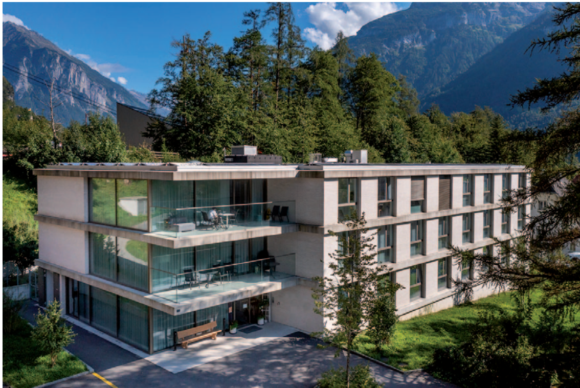
Im Lenggasshüüs befindet sich das neue Zentrum für Alterspsychiatrie

Ab Februar 2022 bietet die Privatklinik Meiringen mit dem Zentrum für Alterspsychiatrie ein integriertes Angebot für Menschen im dritten Lebensabschnitt.